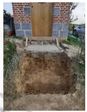
Travaux de déblaiement et de terrassement pour la pose de l'escalier massif.