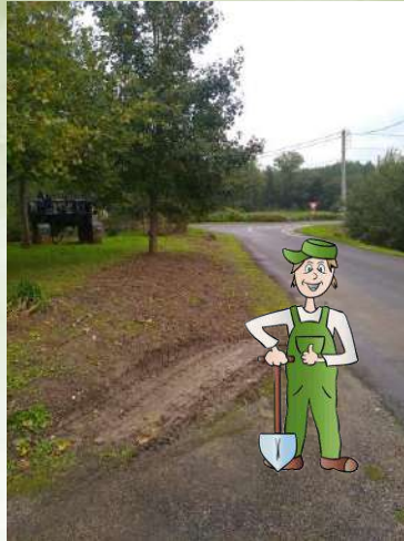
Réaménagement de l'espace vert du Pont des Bergers.