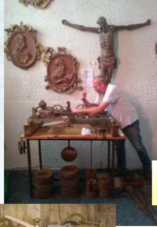
Exposition de l'ancien mécanisme et des aiguilles de l'horloge.