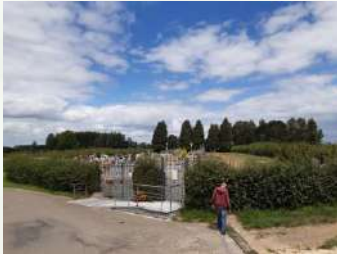
Taille des haies après la nidification des oiseaux.