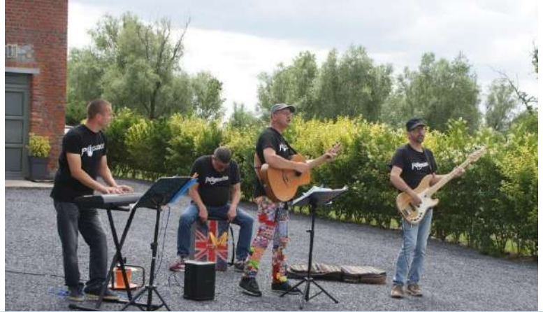
Un été qui commence avec la joie, la bonne humeur et le rythme entraînant du groupe Palissandre.

Une édition de la fête de la musique version COVID. Les artistes se sont rendus dans plusieurs quartiers du village à votre rencontre pour jouer quelques morceaux et saynètes.