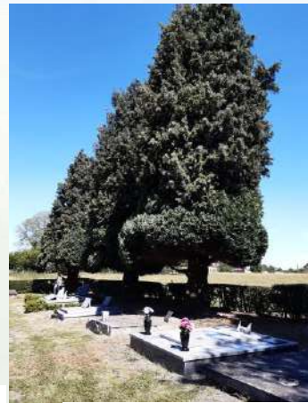
Elagage des thuyas aux deux cimetières.