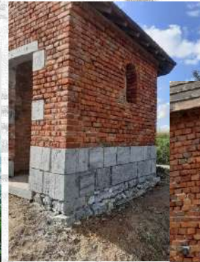
Travaux de sablage.