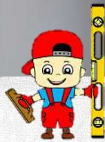
Pose d'appuis de fenêtres en pierre bleue et des menuiseries.