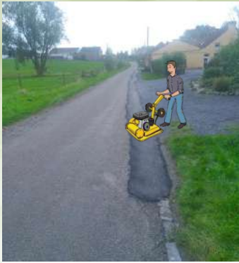
Utilisation de 16 tonnes de macadam pour reboucher les nids de poule et ornières.