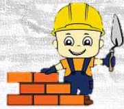
Travaux de déjointement et de reprise de la maçonnerie.