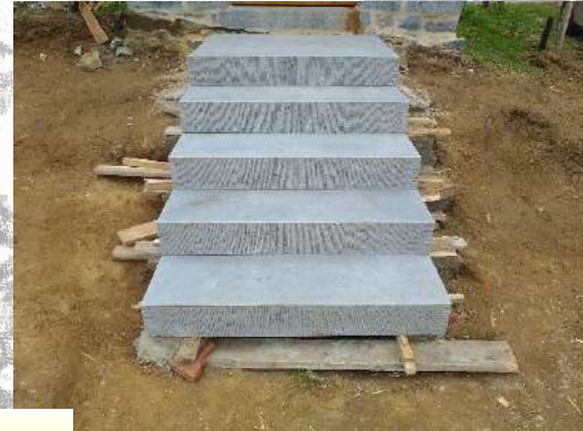
Pose de l'escalier.