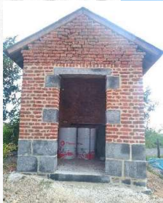
Travaux de rejointement.